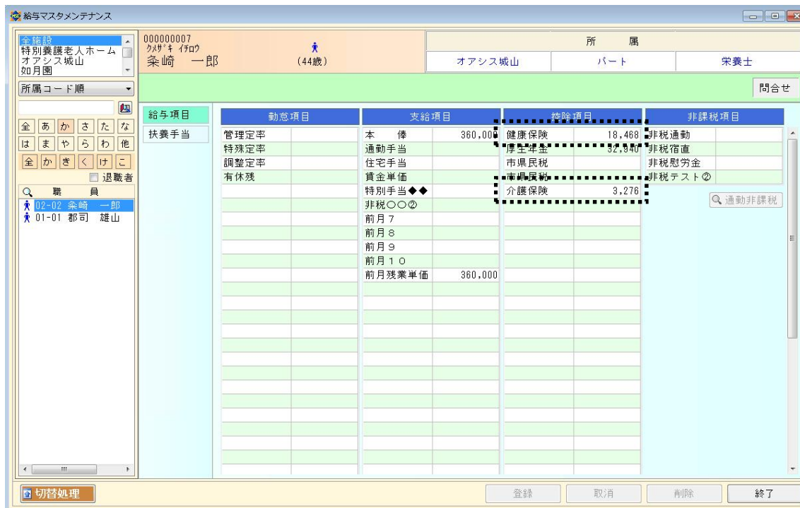
(更新処理後の[202]給与マスタメンテナンス)